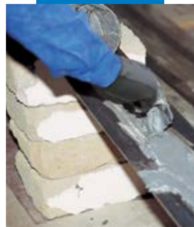
Aplicação de Adesilex PG1 sobre chapa metálica