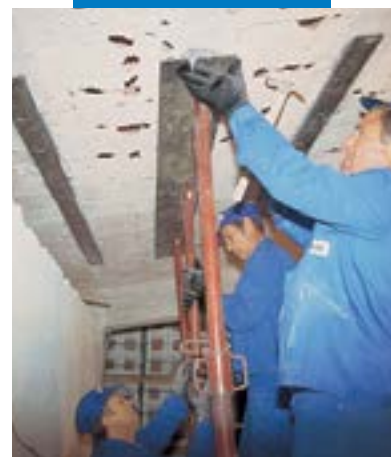
Aplicação de chapa metálica para o reforço estrutural