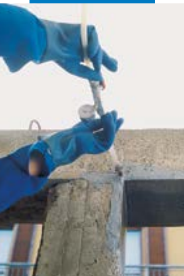
Viga tratada com Adesilex PG1