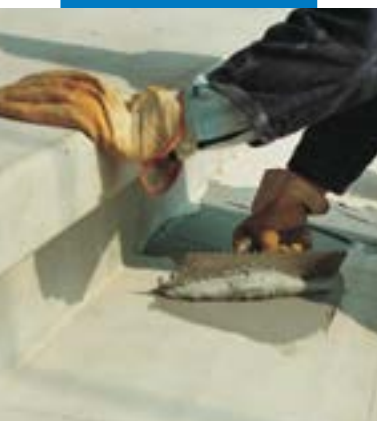
Aplicação com espátula dentada de Adesilex PG1 para colagem estrutural de degraus prefabricados