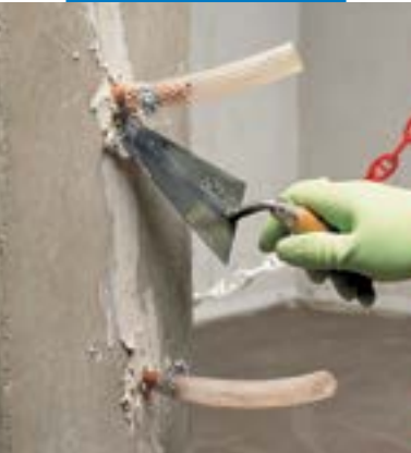
Fixação de tubos de injeção e selagem de fissuras para consolidação estrutural

Durante a aplicação, utilizar luvas e óculos de proteção e tomar todas as precauções habituais na manipulação de produtos químicos. No caso de contacto com os olhos ou a pele, lavar imediatamente com água