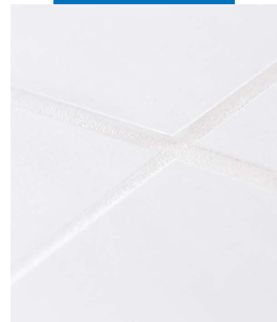
Pavimento betumado com Kerapoxy Easy Design

Kerapoxy Easy Design está disponível em 41 cores (40 cores mais neutro - no. 700 translúcido).