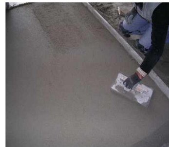
Talochamento da superfície final