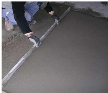
Regularização com régua metálica