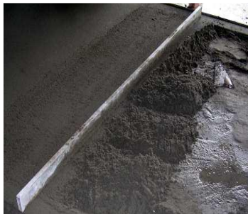
Colocação da argamassa

as regras e condições recomendadas pelo fabricante do revestimento, cumprindo escrupulosamente o teor de humidade exigido.