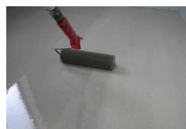
Uniformização da superfície c/ rolo de bicos