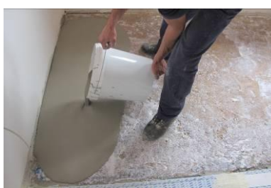
Aplicação do PLAN LEVEL 315