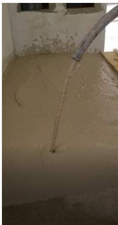
Aplicação do PLAN FLUID