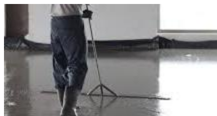
Uniformização da superfície