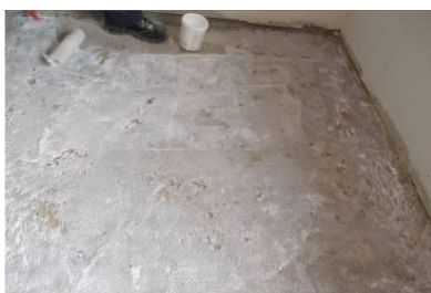
Aplicação do primário MICROART AD 21