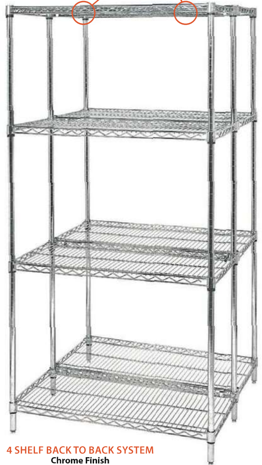
4 SHELF BACK TO BACK SYSTEM Chrome Finish

S-HOOKS For continuous runs of shelving. Two hooks should be placed per shelf where two posts are not utilized.