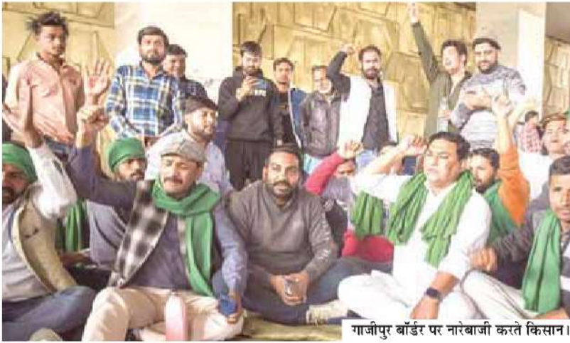
गाजीपुर बॉर्डर पर नारेबाजी करते किसान।