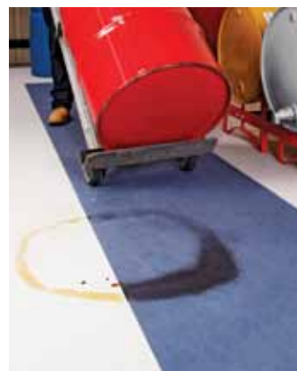
El tapete Grippy resiste el tráfico peatonal y el paso ligero de vehículos.

El absorbente Grippy está disponible en tapetes y rollos.