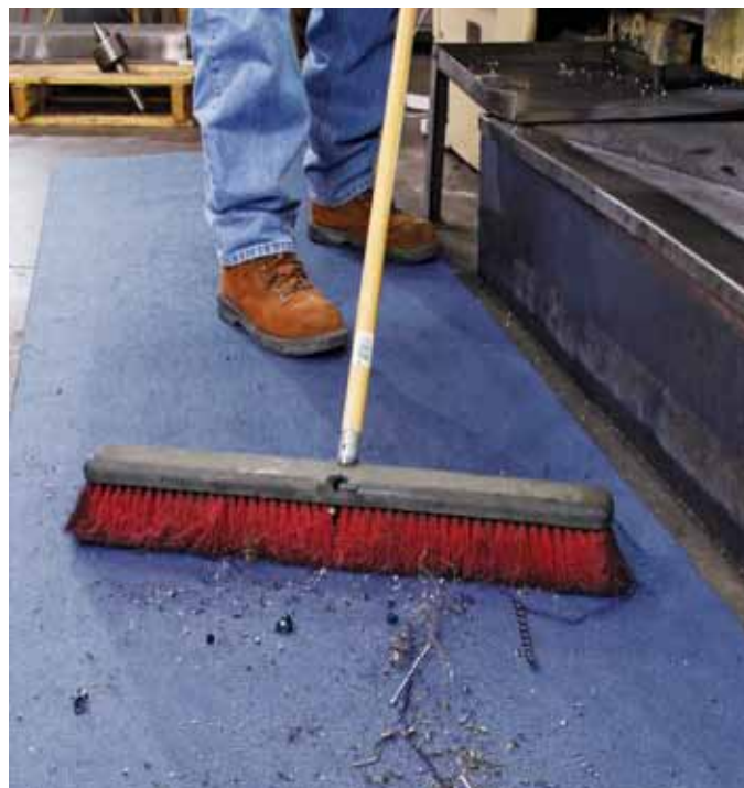
El tapete Grippy se queda plano, no se enrolla, amontona o desliza.

Para una lista completa de los productos Grippy, visite nuestro sitio www.newpig.com/grippy