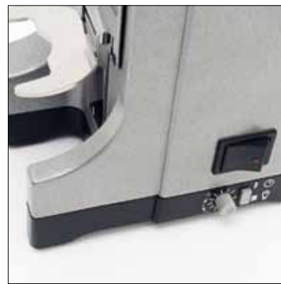
Manopola regolazione dose Dose adjustment knob