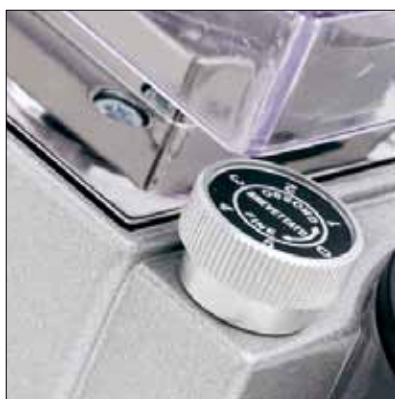
Pomello di regolazione micrometrica Eureka Innovative micrometric regulation

The micrometric adjustment of grinding thickness with rotor blade axial slide enables the best possible grinding. Its instant dosing ensures the best quality and aroma. Mignon instant grinder is a fundamental partner to all baristas that wish to satisfy their customers needs with decaffeinated or "gourmet" coffee. Notwithstanding its dimensions, Mignon Istantaneo guarantees the same grinding quality and many other features as all other Eureka professional grinders. These relevant features make Mignon the perfect instant grinder to offer to your customers an alternative to the traditional blend.