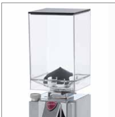
Campana trasparente da 0,50 Kg Transparent bean hopper (0,50 Kg)