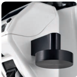
Pressino laterale in metallo Metal side tamper - Dimensioni · Available sizes (Ø): 53 - 57 mm - Disponibile per · Available for: Zenith / Olympus on-demand