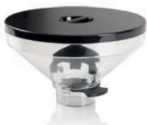
Campana capacità ridotta Reduced capacity hopper - 300 gr · 10.58 oz - Disponibile per · Available for: Olympus / Zenith