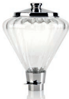
Campana in vetro Glass hopper - 1 Kg · 2.2 lb - Disponibile per · Available for: Olympus / Zenith / Drogheria