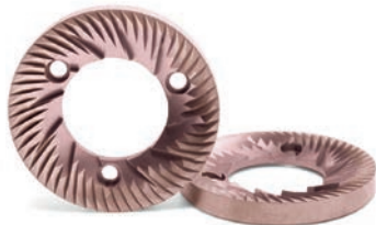
Macine Red Speed Red Speed burrs 65 ÷ 75 mm