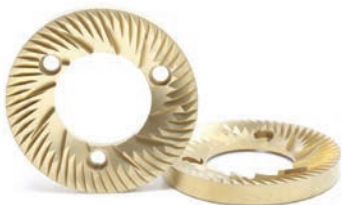
Macine in Titanio Titanium burrs 65 ÷ 75 mm