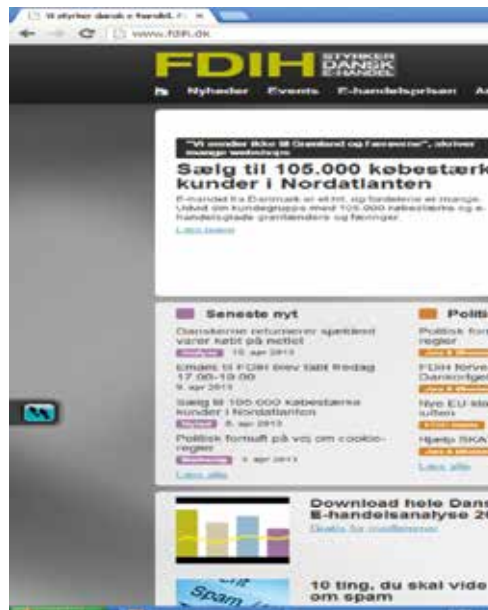
b) Eksempel på navigation på mobilenhed

Når brugeren har accepteret eller afvist cookies, vil informationen forsvinde fra skærmen, men de små fodspor fremgår tydeligt på siden under hele brugerens besøg.