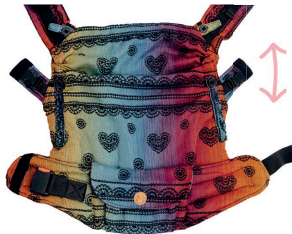
Regulacja wysokości panelu Adjustment of the height of the carrier's panel