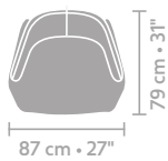
metrage (m) armchair 87 x 79 4,84