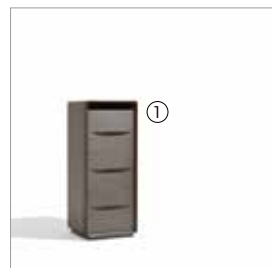
1 Frame 59230 saddle leather tobacco fin.2B