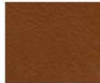
08-445 DARK TAN CUOIO SCURO