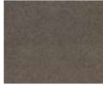
31-3416 FOSSIL FOSSILE