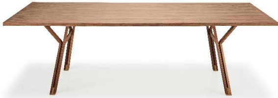
Table with a solid walnut structure with burnished brass details. Top in walnut veneer.

Tavolo con struttura in massello di noce con dettagli in ottone brunito. Piano in tranciato di legno di noce.