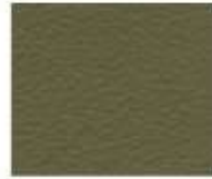
07-818 BEETLE SCARABEO