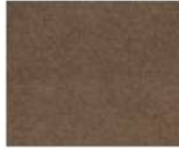
31-3406 TOBACCO TABACCO