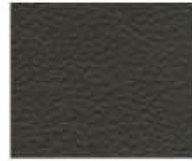
07-808 UNDERGROWTH SCOTTOBOCO