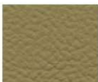
09-813 AMBER GREEN VERDE AMBRA