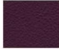
07-970 AUBERGINE MELANZANA