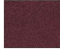
31-3424 PORT WINE PORTO