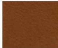
08-445 DARK TAN CUOIO SCURO