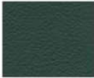
07-819 JUNGLE GIUNGLA