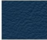
07-900 BLUE BLU