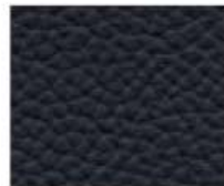
09-218 ATLANTIC GREY ATLANTICO