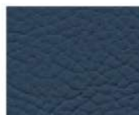
09-903 GENTIAN BLUE GENZIANA