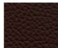
09-610 COFFEE BROWN CAFFÈ