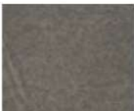
40-238 VINTAGE GREY GRIGIO VINTAGE