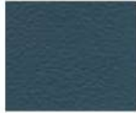
07-902 CORAL BLUE BLU CORALLO