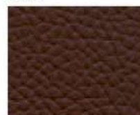
09-603 WENGÉ WENGÉ