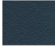
07-907 MEDITERRANEAN MEDITERRANEO