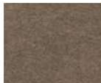
40-632 VINTAGE TERRA TERRA VINTAGE