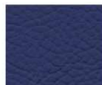
09-904 INDIGO INDACO