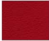
07-701 JESTER RED ROSSO GIULLARE