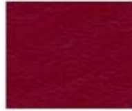
07-712 CHILI RED ROSSO CHILI