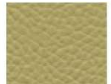
09-806 ASPARAGUS GREEN ASPARAGO