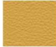
07-921 DANDELION TARASSACO