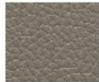
09-223 SHARK GREY SQUALO