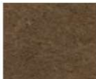
40-454 VINTAGE LEATHER CUOIO VINTAGE