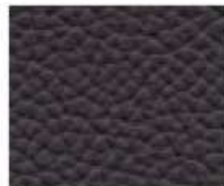
09-217 HIPPO GREY IPPO POTAMO