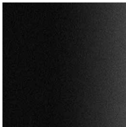
601 FT black