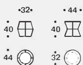
Pouf - botte e clessidra / Pouf - barrel and hourglass