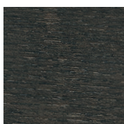
HK Grigio Plumbeo \ Dark Grey