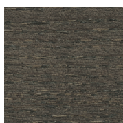
HJ Moka \ Moka