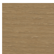
SG Anilina Beige \ Beige Aniline