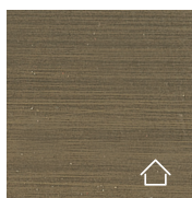
Ottone brunito \ Bronzed Brass