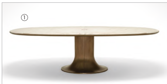
1 Mizar 73027 Calacatta gold marble

Tavolo ovale top in marmo Oval table with marble top cm 270 x 140 x h 73 in 106 3/8 x 55 1/8 x h 28 3/4