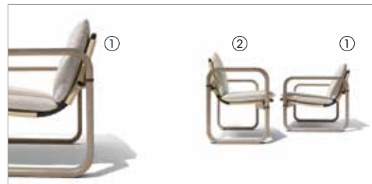
1 Loop 88210 jimmiz mèlange 1042 fin. 3F 2 Loop 88200 jimmiz mèlange 1042 fin. 3F

Poltroncina bassa in frassino e alluminio Low small armchair in ash wood and aluminum cm 76 x 78 x h 75 in 30 x 30 3/4 x h 29 1/2