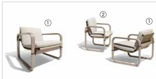
1 Loop 88210 jimmiz mèlange 1042 fin. 3F 2 Loop 88200 jimmiz mèlange 1042 fin. 3F