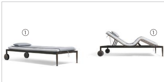
1 Gea 87060 jimmiz plain 1037 +87061 jimmiz mélange 1040