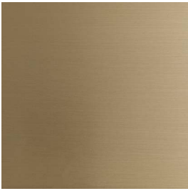
Ottone Naturale Satinato