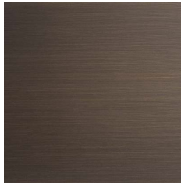
Ottone Brunito Spazzolato a mano