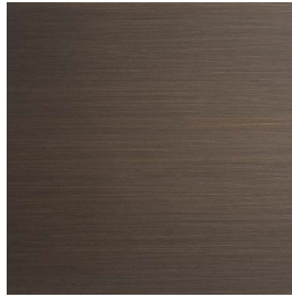
Ottone Brunito Spazzolato a mano