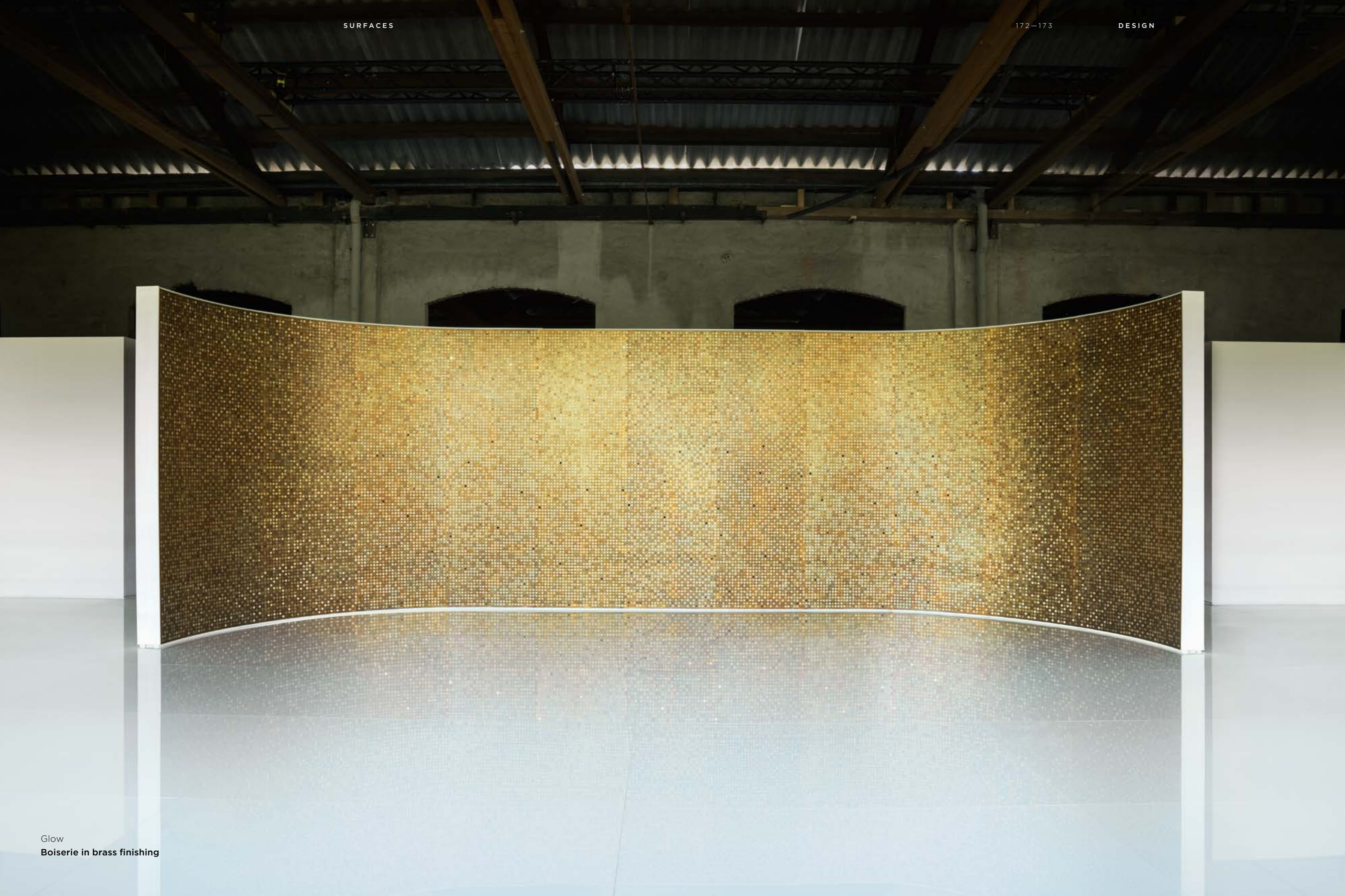
Glow Boiserie in brass finishing