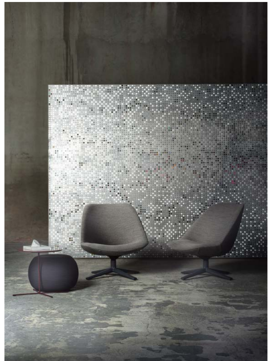
Glow Boiserie in brass finishing