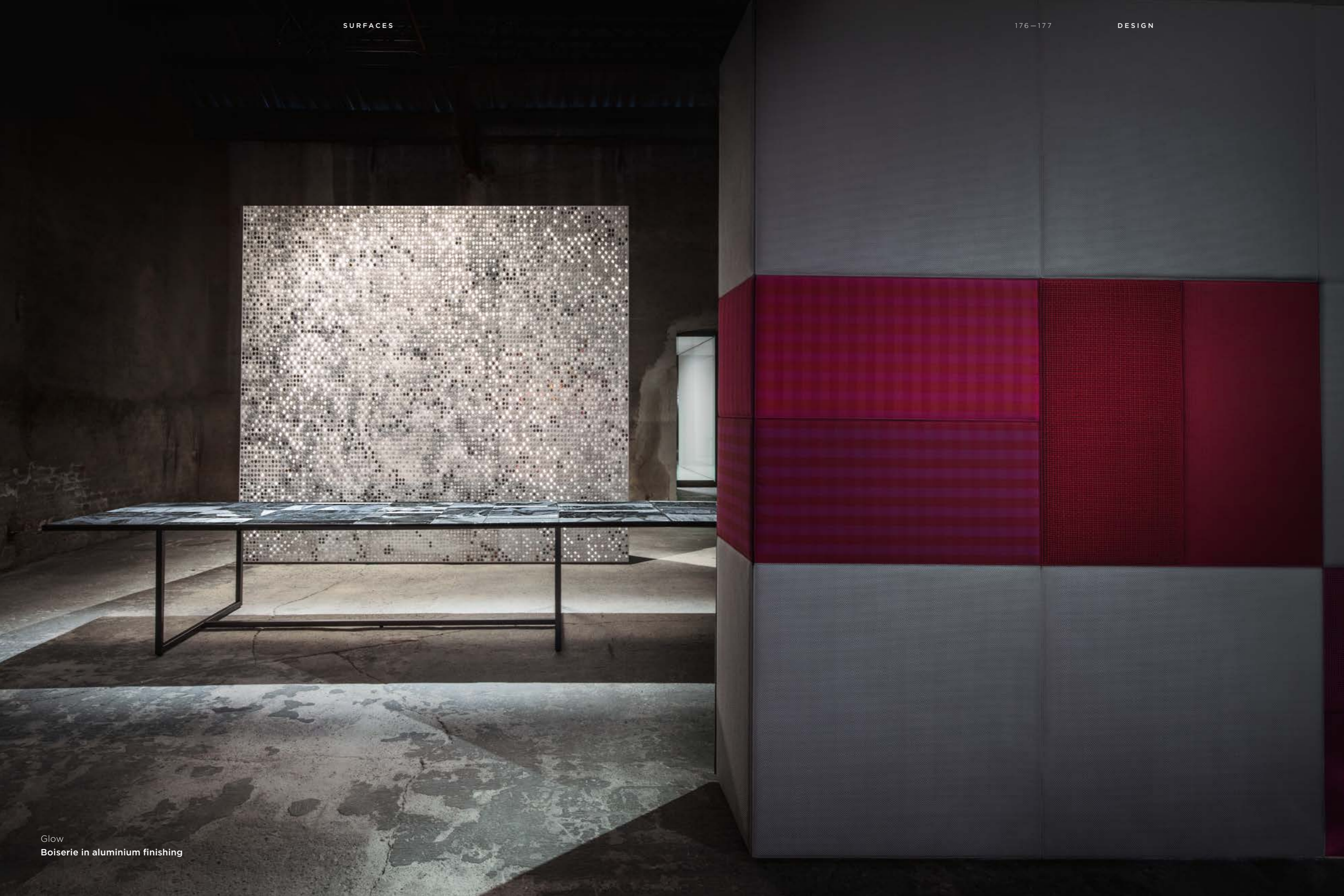
Glow Boiserie in aluminium finishing