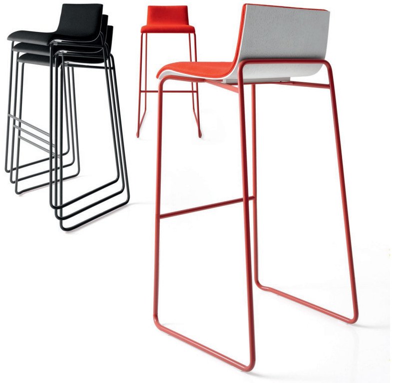
2574 BW - 2590 BW

Sgabello impilabile con struttura in metallo cromato, scocca in faggio o rovere (naturale, tinto o laccato opaco) completamente a vista.