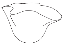
GA253 Vaso acciaio/foglia argento Vase steel/silver leaf cm 60 x h 35 in 23 2/4 x h 13 3/4