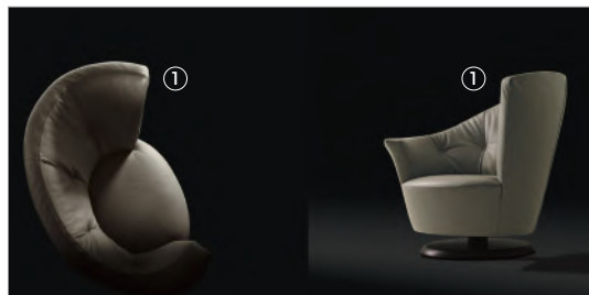
1 Arabella 50531 leather 9162

Cuscino Cushion cm 35 x 25 x h 6 in 13 6/8 x 9 7/8 x h 2 3/8