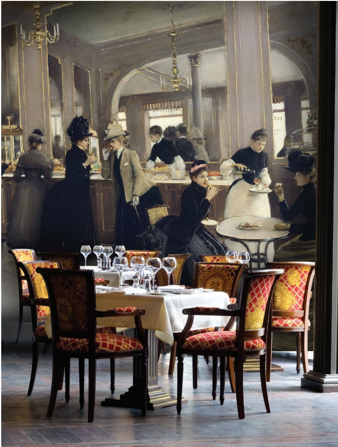
Ref.00-010695. "La pâtisserie Gloppe, avenue des Champs-Élysées " - 1889 - Béraud Jean-François

Barrisol® and Artolis® ceiling and wall coverings are particularly well-suited to public spaces because they comply with security, health and safety standards and boast acoustic and other properties which make them the ideal solution for your interior design schemes and projects.