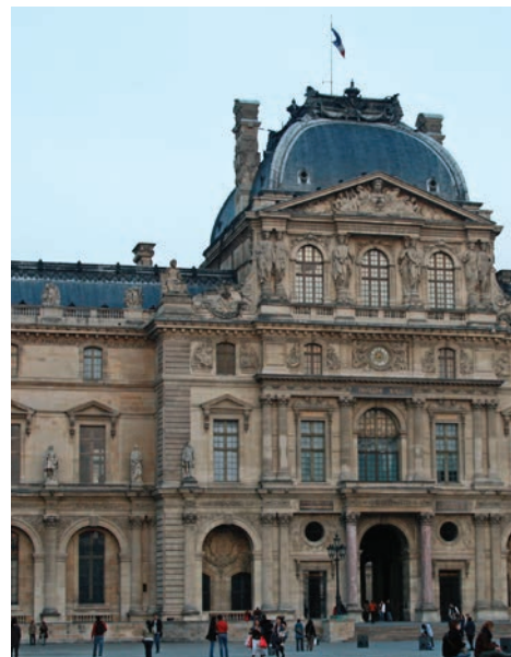
Le Musée du Louvre. Paris

Ce patrimoine artistique, ces œuvres majeures de l'histoire de l'Art peuvent désormais habiller nos intérieurs, décorer vos projets, cohabiter avec des décors actuels, des ambiances plus classiques, ou s'incorporer dans un style contemporain.