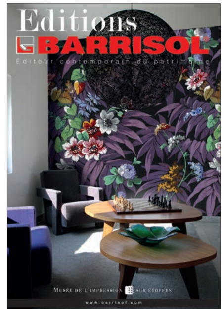
Editions Barrisol® - Musée de l'Impression sur Étoffes. Tome 2. Juin 2014 - 92p