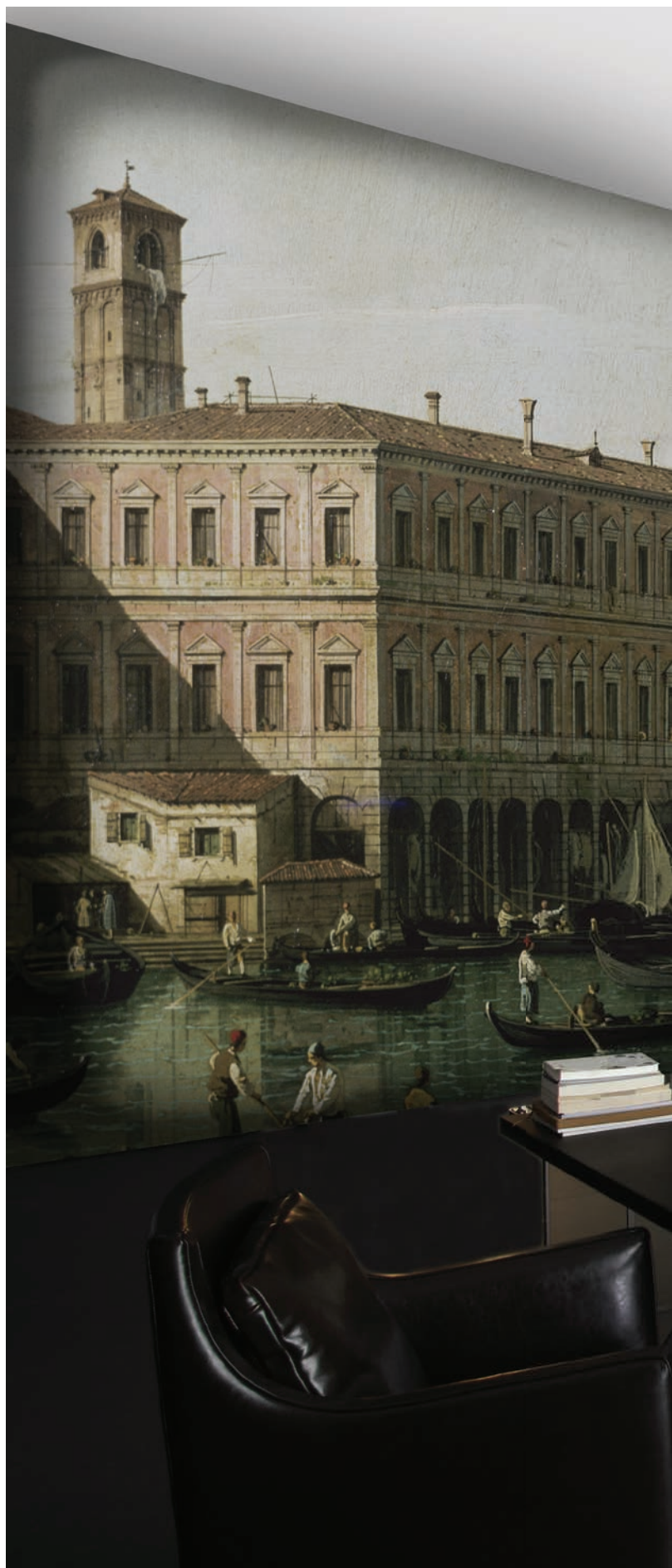
Ref. 71-001100. "Le Grand Canal, vu du pont du Rialto" -1730 - Canaletto Antonio