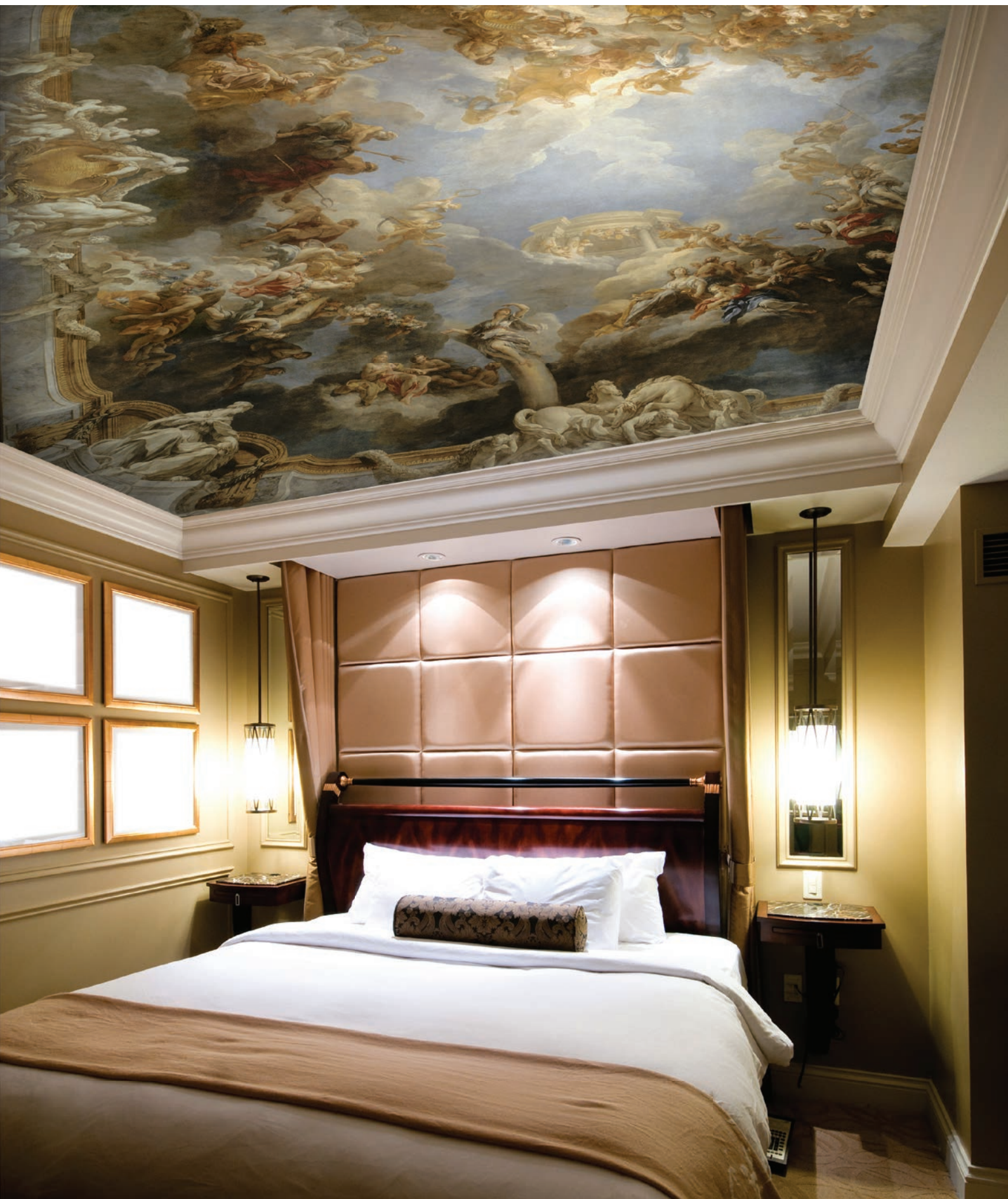
Ref. 01-018370. "Plafond du salon d'Hercule - XVIII ème - Lemoyne François