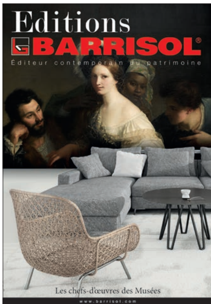
Editions Barrisol® - Les chefs-d'œuvres des Musées. Tome 1. Novembre 2013 - 92p

Découvrez l'ensemble des collections des Editions Barrisol®, réunies par thèmes, au travers de nos trois superbes catalogues. Véritables sources d'inspirations, les œuvres des musées s'invitent dans la décoration d'aujourd'hui, devenant plus actuels que jamais.