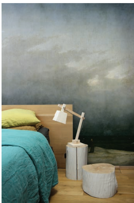
Ref.04-501017. "Moine au bord de la mer" - 1809 - Friedrich Caspar David