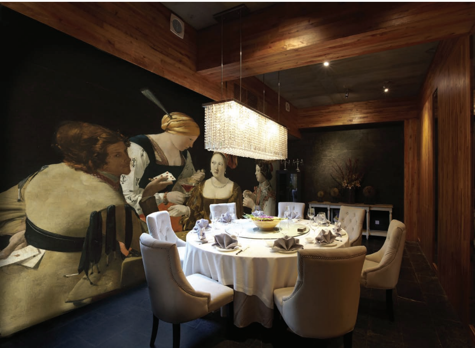
Ref.97-016098. "Le tricheur à l'as de carreau" - XVII ème - Georges de la Tour