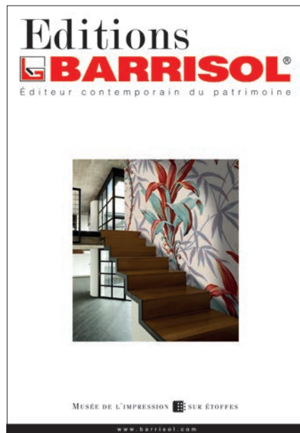
Editions Barrisol® - Musée de l'Impression sur Étoffes. Tome 1. Juin 2013 - 72p