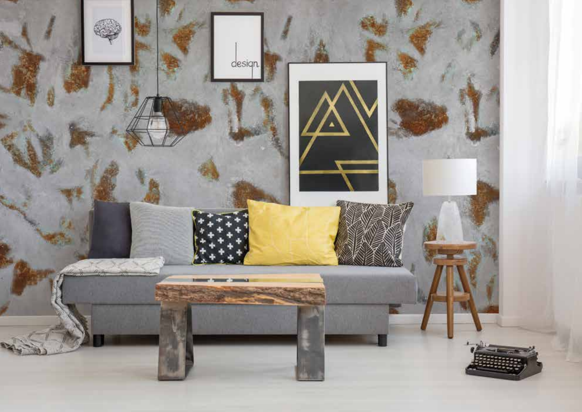
EFFETTO RUGGINE A CHIAZZE TRAVERTINO NERO + OLD RUST FERRO + MILLENNIUM ARGENTO