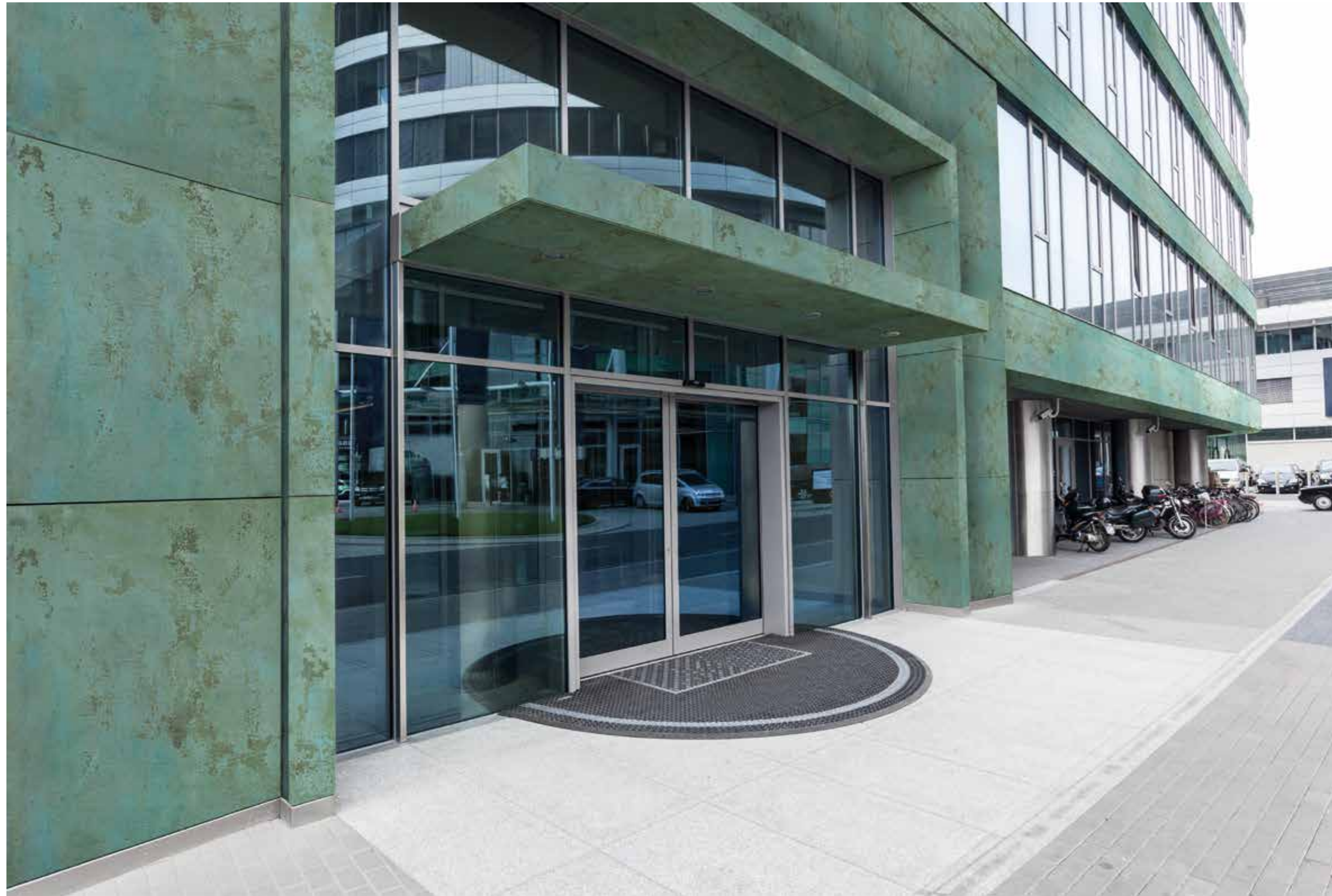
EFFETTO VERDE RAME IN ESTERNO OLD RUST RAME