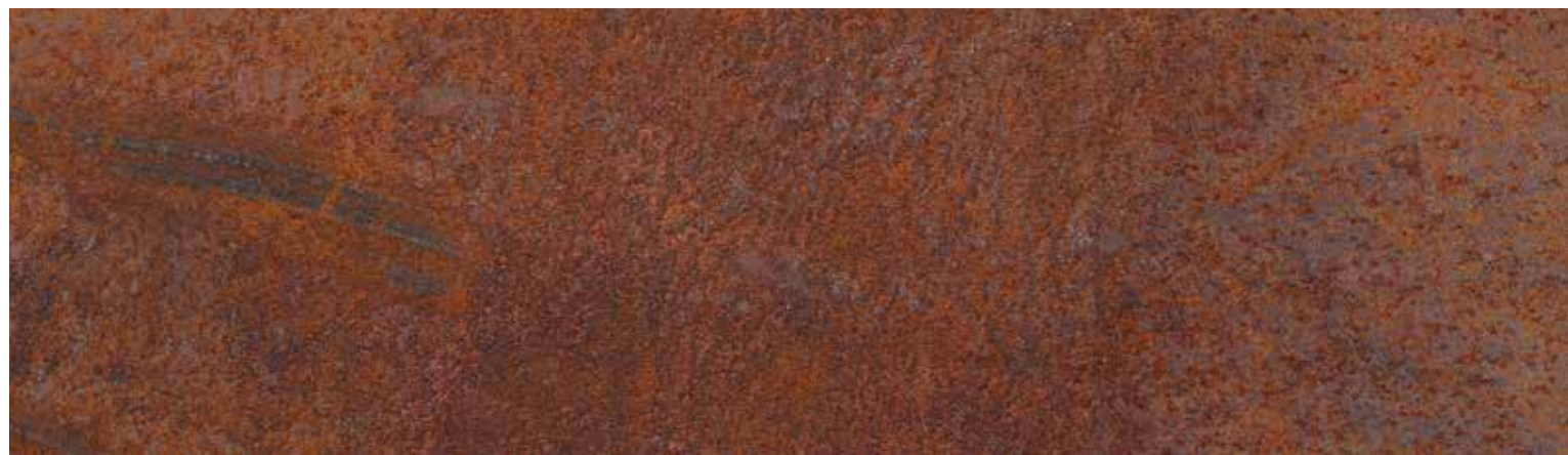
EFFETTO RUGGINE IN ESTERNO OLD RUST FERRO