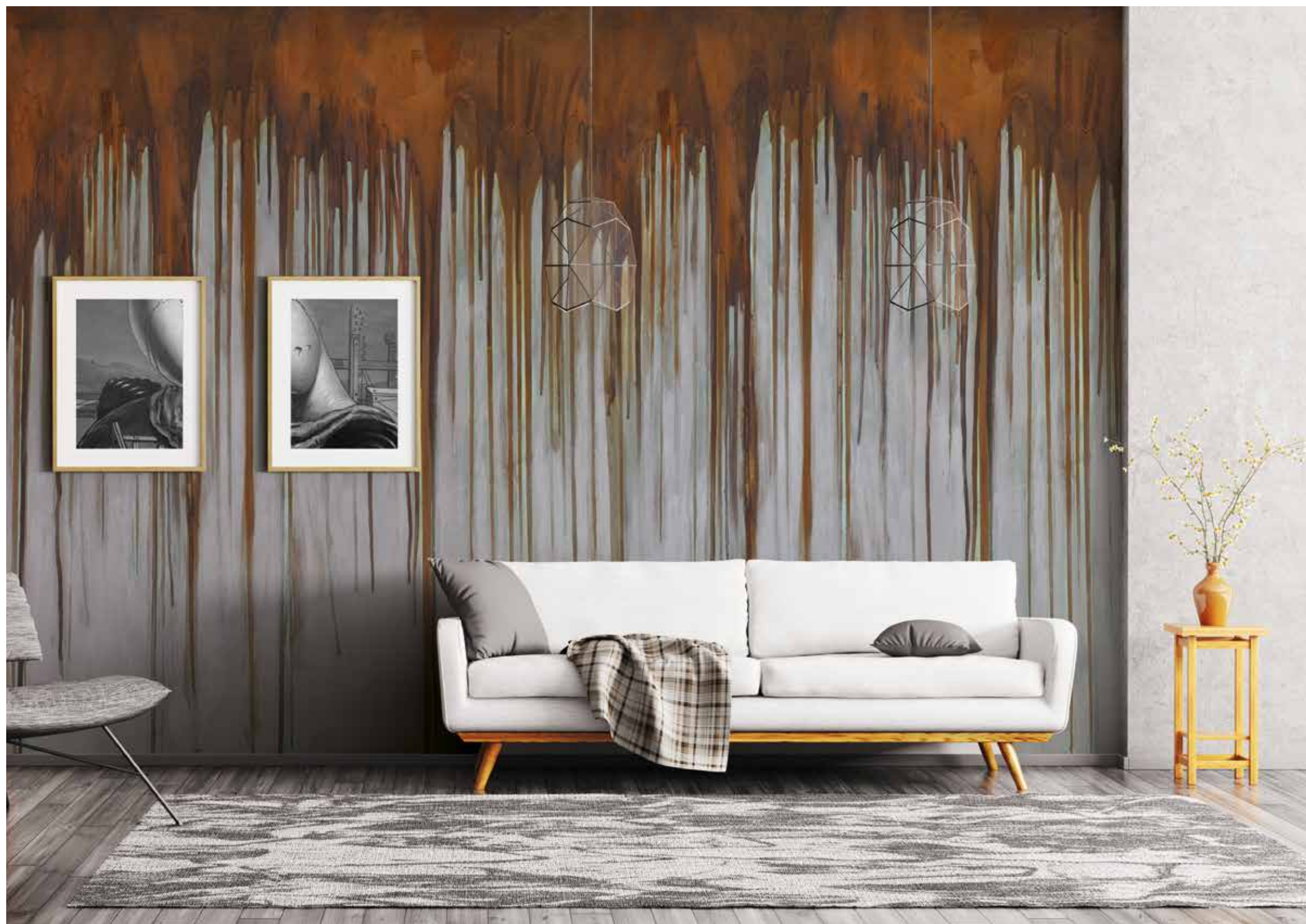
EFFETTO COLATURA DI RUGGINE OLD RUST FERRO + MILLENNIUM ARGENTO