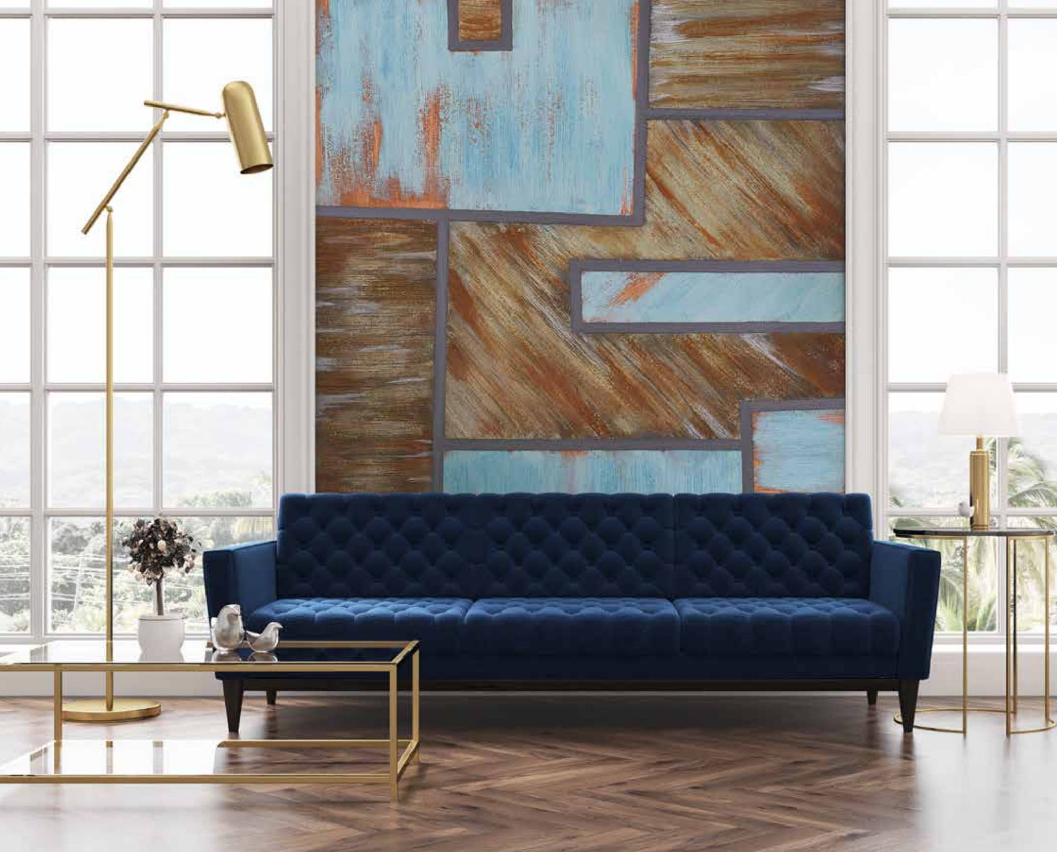
EFFETTO PATCHWORK KRONOS XS NERO + OLD RUST RAME + MILLENNIUM RAME OLD RUST FERRO + MILLENNIUM ARGENTO