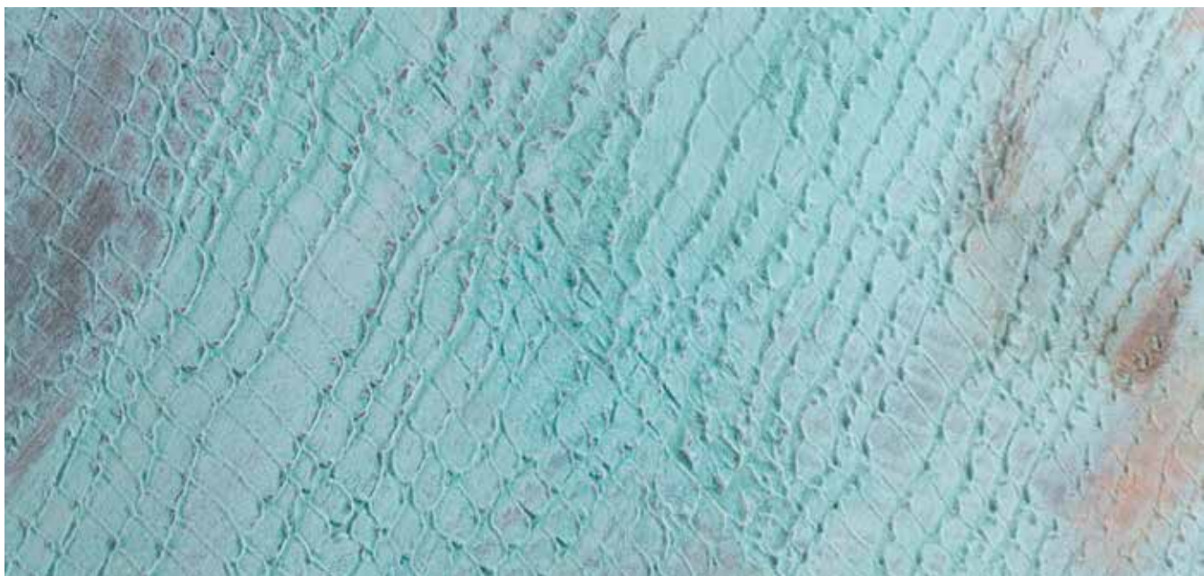
EFFETTO COCCODRILLO VERDE RAME KRONOS XS NERO + OLD RUST RAME + OLD RUST FERRO