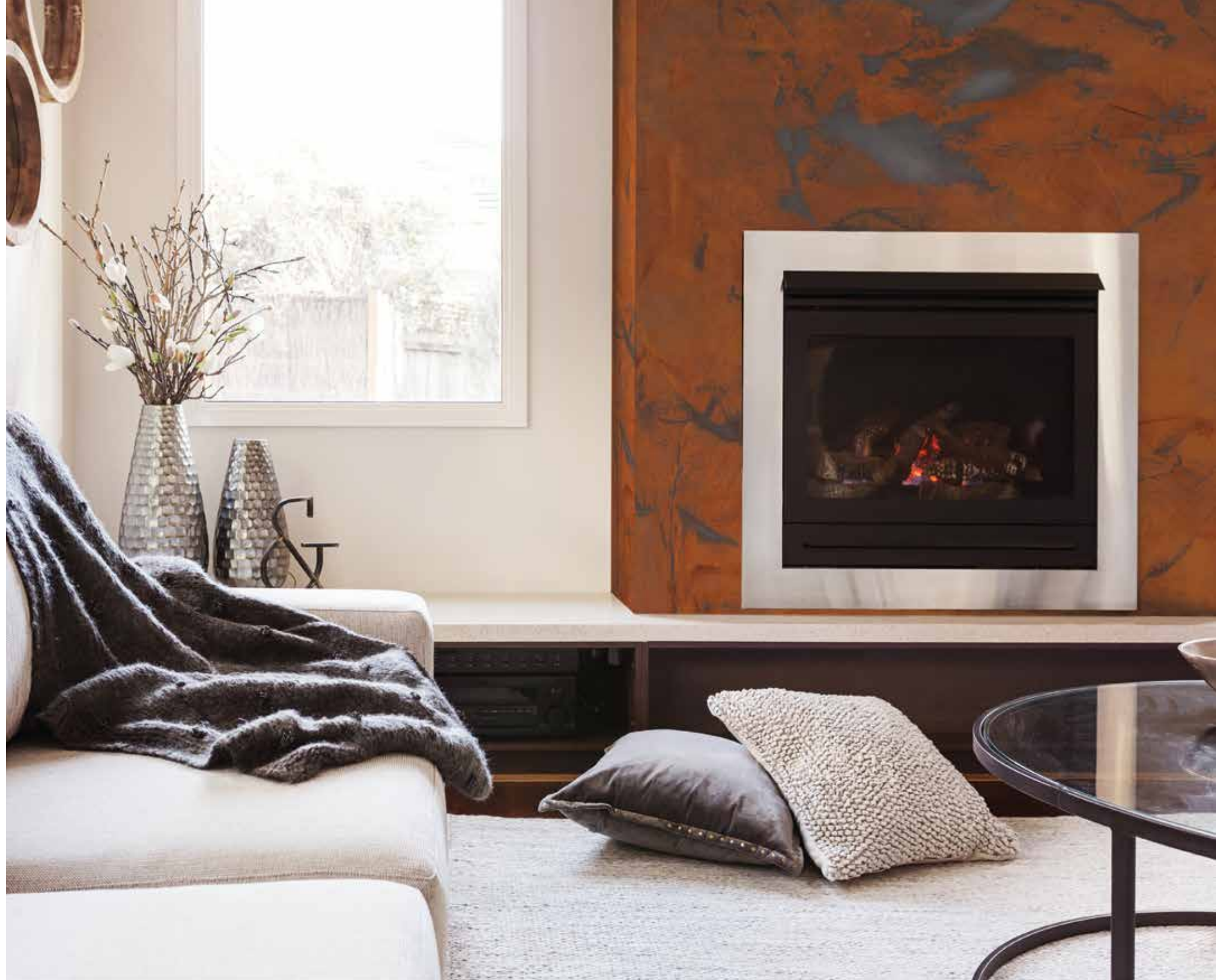
EFFETTO RUGGINE OLD RUST FERRO