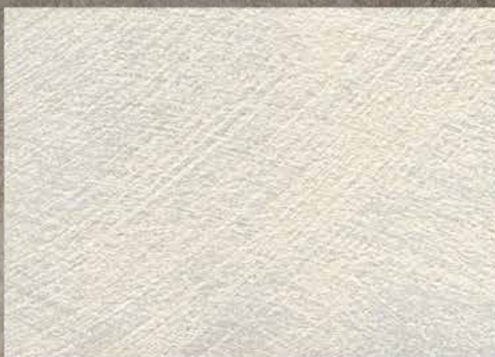
BASE ARGENTO / SABBATO XS

The colours in this catalogue can all be reproduced using the Giolli Colour System.