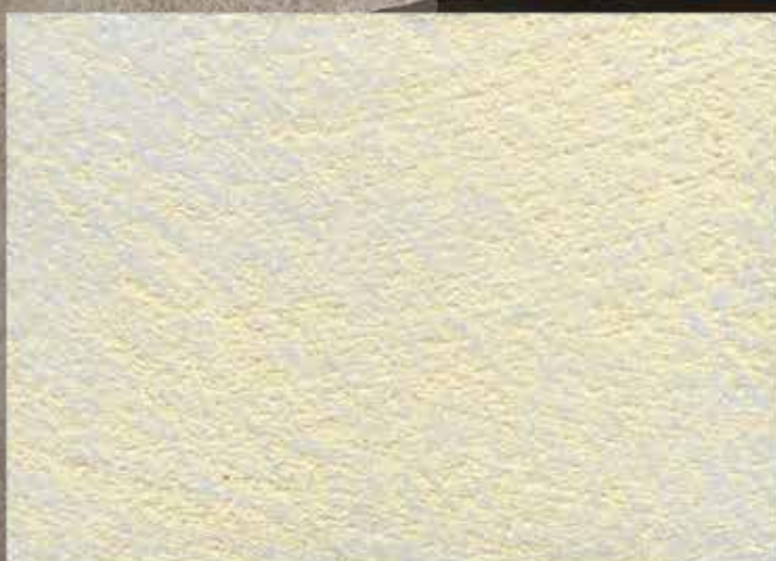
BASE ORO / SABBATO NORMALE