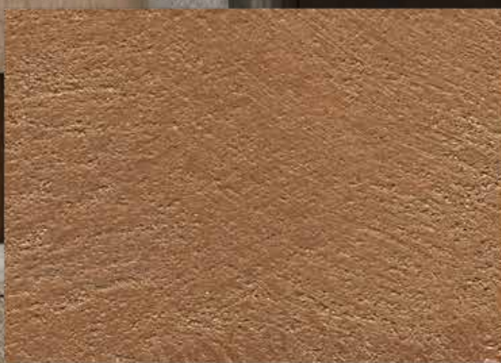
BASE BRONZO / SABBATO NORMALE