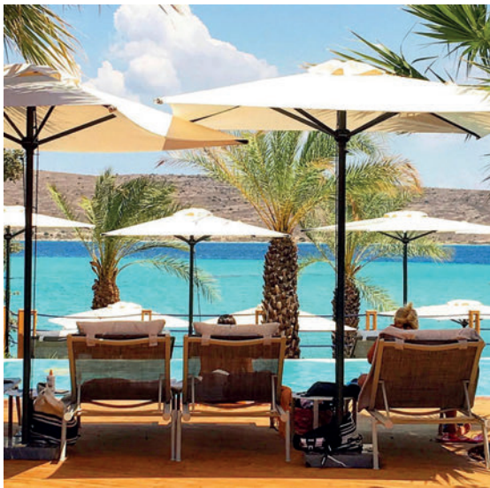
ALACATI RESORT HOTEL - TURKEY