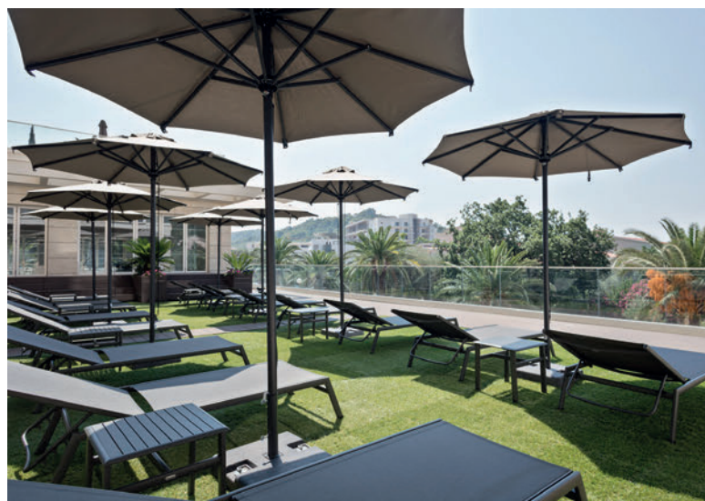
MELIA BUDVA - MONTENEGRO