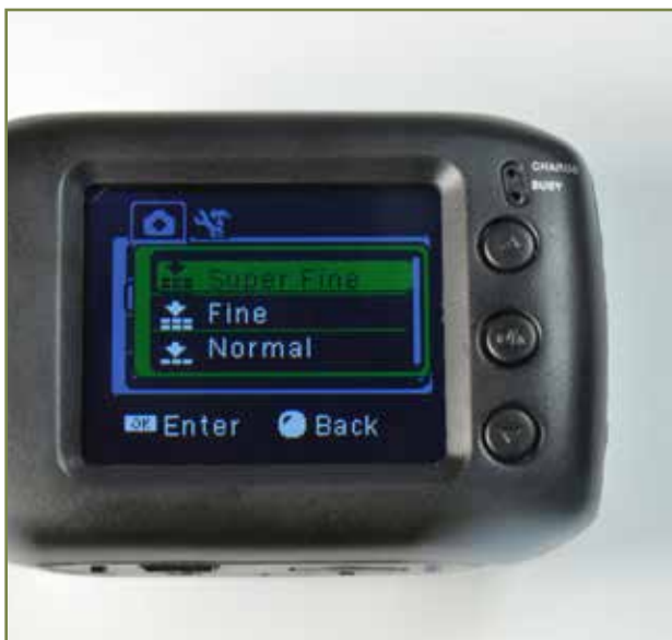
サブメニュー内の好みの設定を選択