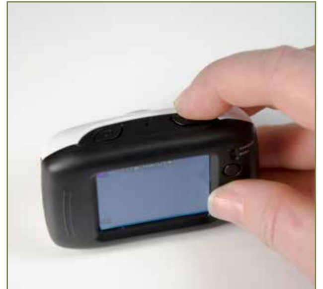
6・写真撮影・動画をとる場合シャッターを押す