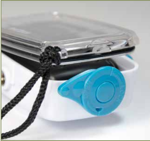
1・ハウジングから取出す