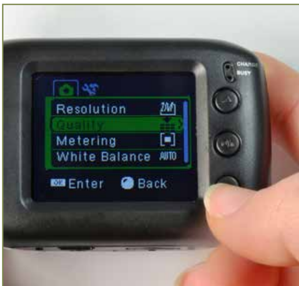
上/下ボタンで選択