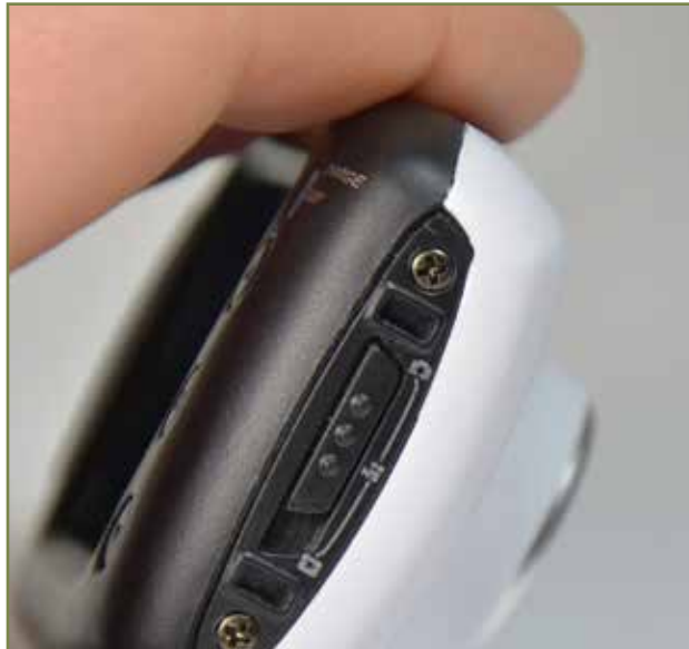
5・モードの選択 (写真モードがデフォルト)