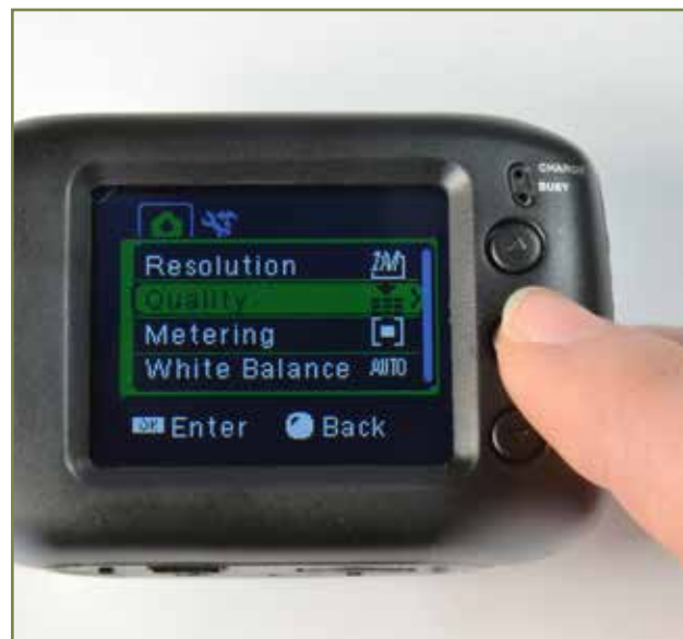
OKボタンでサブメニューを開く