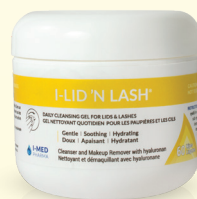
60 lingettes préimbibées