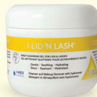
60 Pre-soaked Wipes