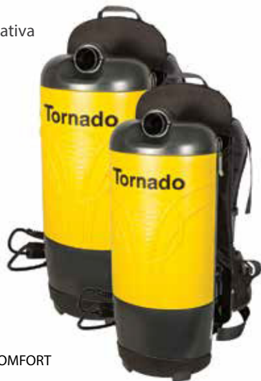
PAC-VAC 10 AIRCOMFORT