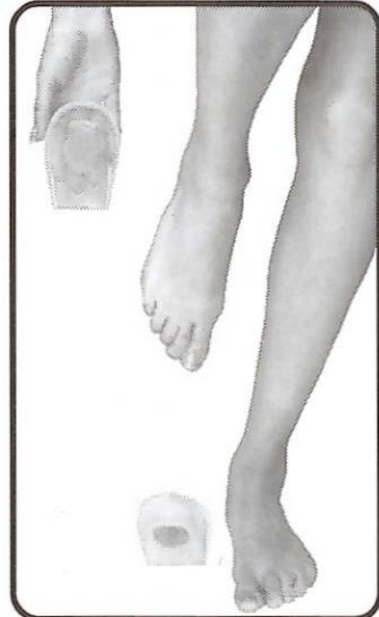
Heel Cup Silicone