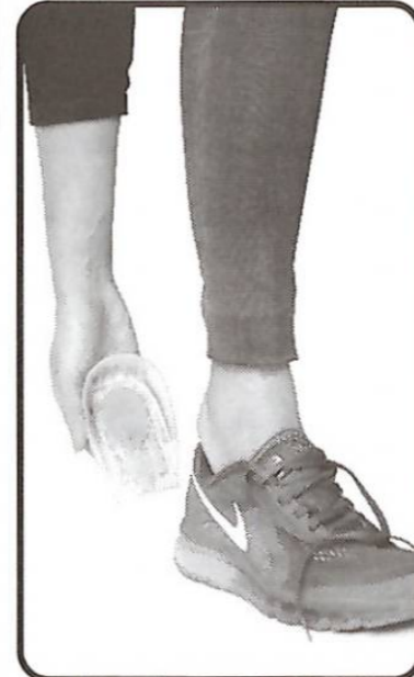
Heel Cushion Silicone