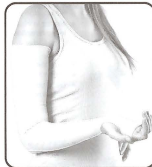
Compression Garment Arm Sleeve + Mitten (with Thumb)