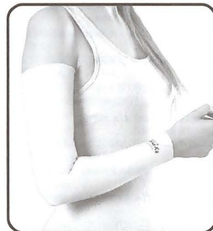
Compression Garment Arm Sleeve