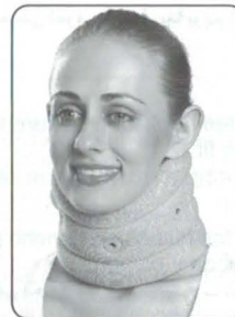
Cervical Collar Soft with Support