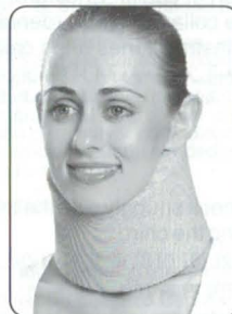
Cervical Collar Soft