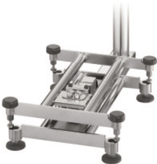
Typical sub-platter / Sous-plateau typique