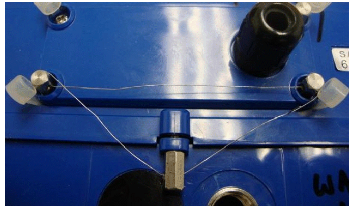
Typical sealing / Scellage typique