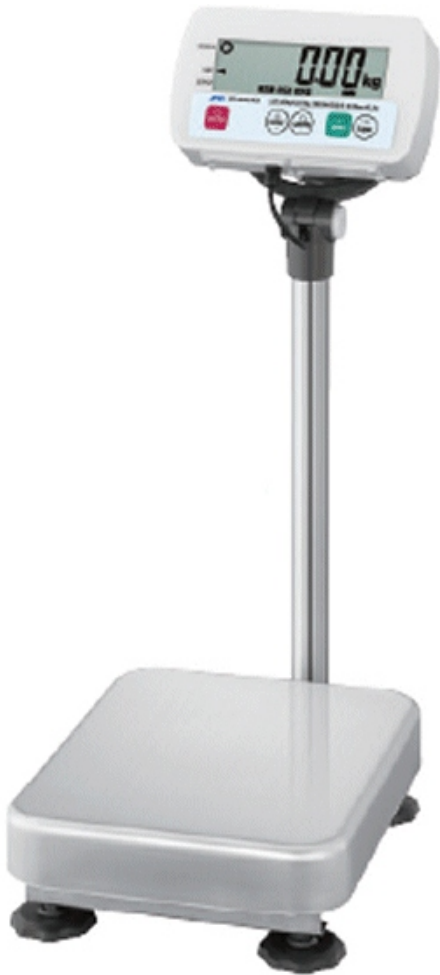
Typical model SC-***KAM* / Modèle typique SC-***KAM*