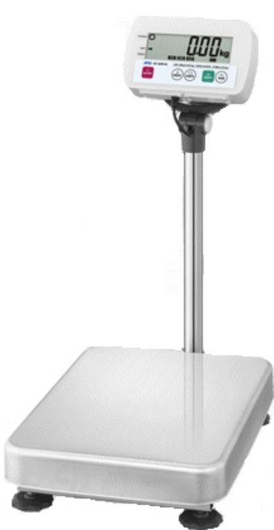
Typical model SC-***KAL* / Modèle typique SC-***KAL*