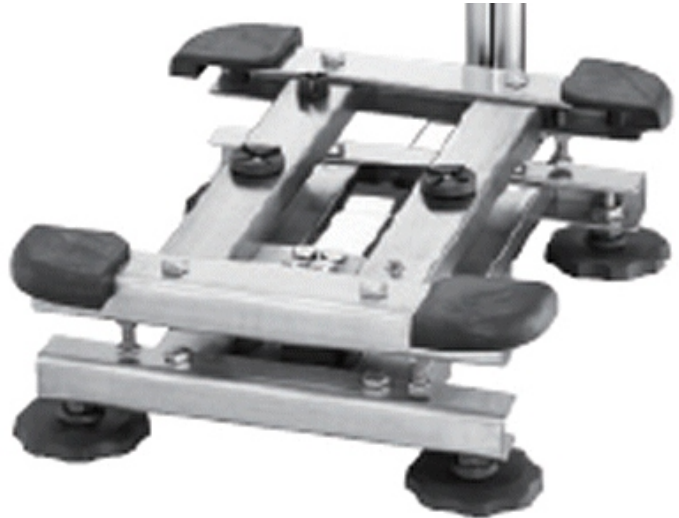
Typical model SC-***KA** subframe / Sous-châssis typique du modèle SC-***KA**