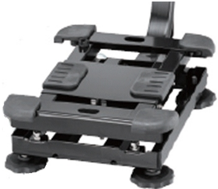
Typical model SE-***KA** subframe / Sous-châssis typique du modèle SE-***KA**