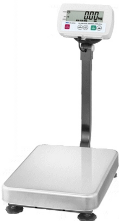
Typical model SE-***KAL* / Modèle typique SE-***KAL*