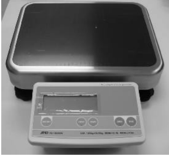
Typical Model FG-***KBM/Modèle typique FG-***KBM