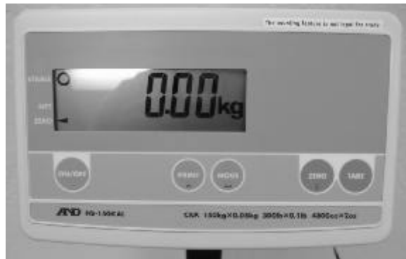
Typical FG series pole mounted display/ Affichage monté sur colonne typique de la série FG