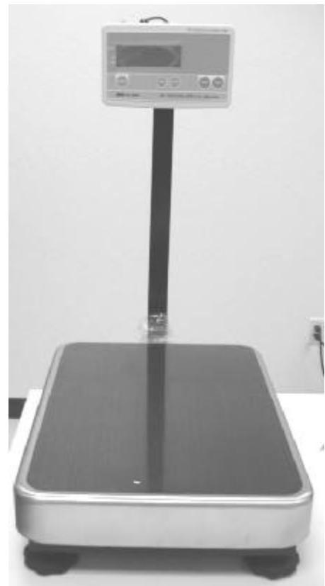
Typical Model FG-***KAL/ Modèle typique FG-***KAL