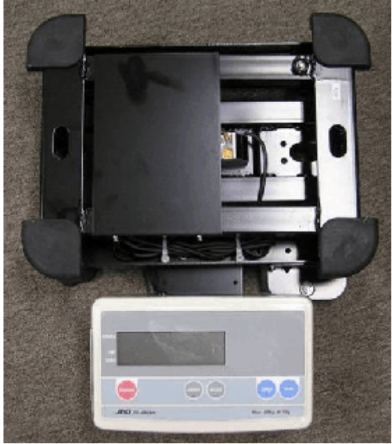
Typical Model FG series sub-platter / Sous-plateau typique de la série modèle FG