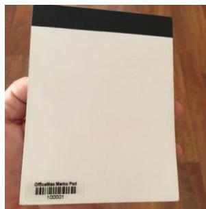
Figure 1 - Back view of SvenPad™

La méthode mécanique est simple et quasiment automatique. Le SvenPad® est composé de 25 paires de pages (50 pages en tout), chaque paire étant elle-même constituée d'une page longue et d'une page courte. L'avant du SvenPad® est le côté qui démarre par une page longue suivie d'une page légèrement plus courte. Le moyen le plus simple pour savoir quel côté correspond au devant, c'est de repérer le code barre « OfficeMax » qui se trouve au DOS de votre carnet. Les pages plus courtes ont été