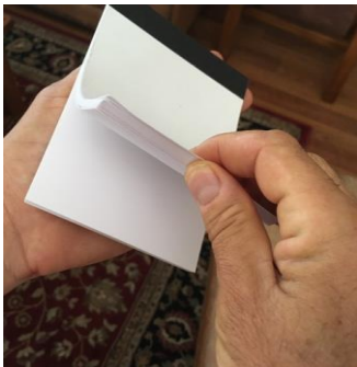
Figure 3 – Démonstration de l'ouverture du carnet

Si vous placez le carnet à plat dans votre main gauche et que vous le feuilletez avec votre pouce droit et votre index en partant des pages du bas, du milieu ou de n'importe quel autre