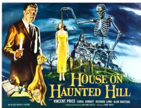
Figure 1 - "La maison de la colline hantée"

Une fois que vous aurez compris la psychologie de ce qui se passe ensuite, vous serez capable d'utiliser ce concept avec de nombreux autres titres de films ou de livres. J'ai choisi de forcer le film « La maison de la colline hantée » parce que c'est un vieux film avec un scénario basique qui se résume quasiment à son titre. C'est aussi un film dont presque personne ne se souvient ! On trouve Vincent Price à l'affiche, et le film raconte l'histoire d'un groupe de personnes qui doit passer une nuit dans une maison