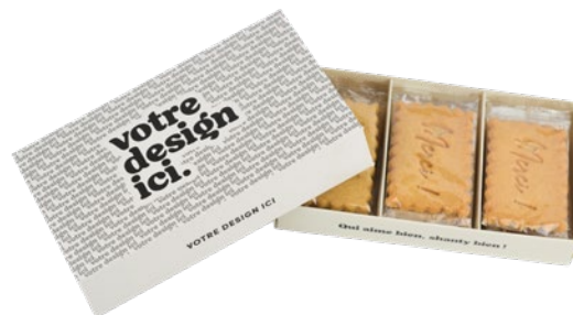
Boîte de 12 biscuits FOURREAU PERSONNALISABLE