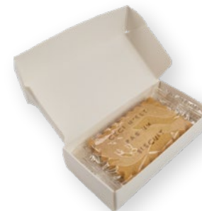
Boîte de 3-4 biscuits SUR-MESURE