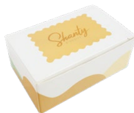
Boîte de 6 biscuits FOURREAU PERSONNALISABLE