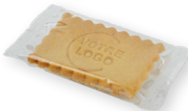
Sachet BISCUIT INDIVIDUEL