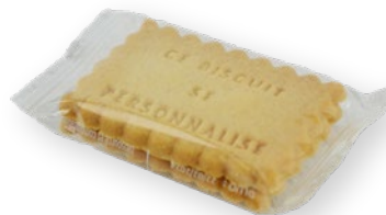
Sachet 2 BISCUITS