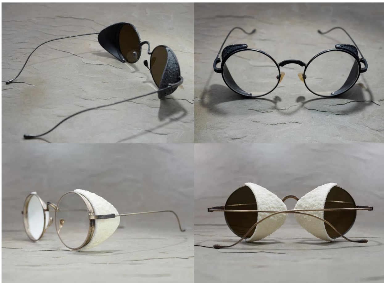
UMA WANG + RIGARDS 联名眼镜系列：The Stone Eclipse