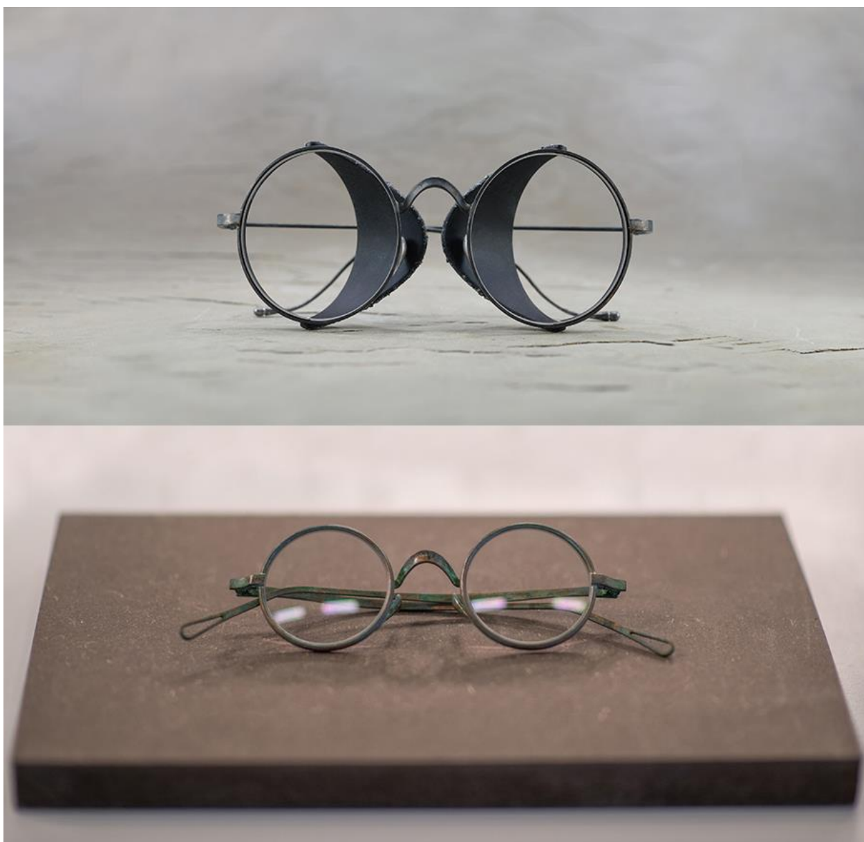
UMA WANG + RIGARDS 联名眼镜系列：（上）The Stone Eclipse （下）The Victorian

王汁独树一帜的美学风范与 RIGARDS 既重视匠心又求新求变的品牌个性在此次合作设计上碰撞出闪光的火花，让包含两款的联名眼镜系列体现了两者身上共有的特质，包括丰富的原创力和琢石铸铁般的创作手法和过程。