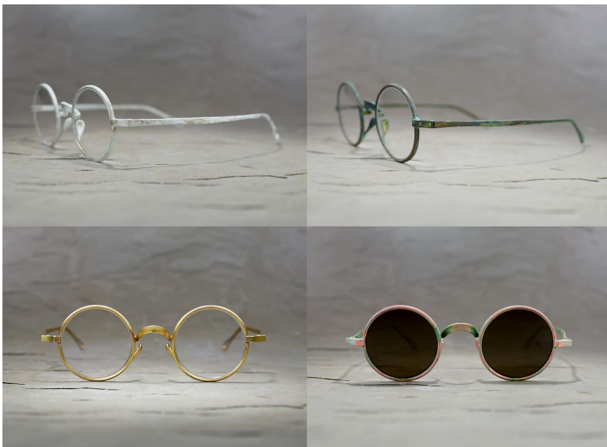
UMA WANG + RIGARDS 联名眼镜系列：The Victorian