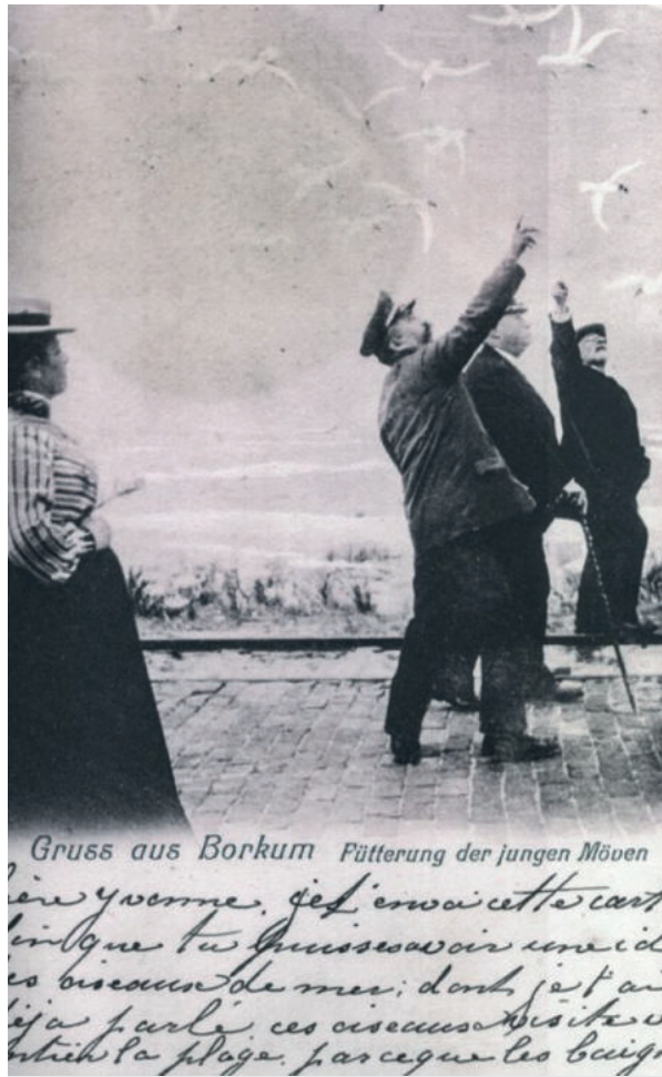
Gruss aus Borkum Pütterung der jungen Möven

...ère yverne, j'est envoie cette carte ...inque tu m'asse voir un id ...es oiseaux de mer; donc j'est an ...ja parle, ces oiseaux visite ...ntier la plage, parce que les beigs