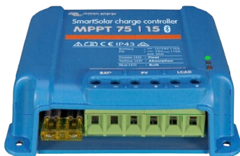
SmartSolar Laadcontroller MPPT 75/15