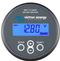
Bluetooth-detectie BMV-712 Smart Battery Monitor