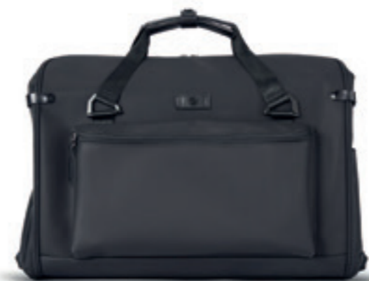
Product Name 產品名稱： Kingsman L 皇家特工

Collection Name 系列名稱： Dark knight 暗黑騎士系列