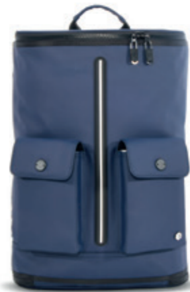
Product Name 產品名稱： Captain M 機長 M

Product Sizing(mm) 產品尺寸(毫米)： 500*250*250(mm) 25(L)