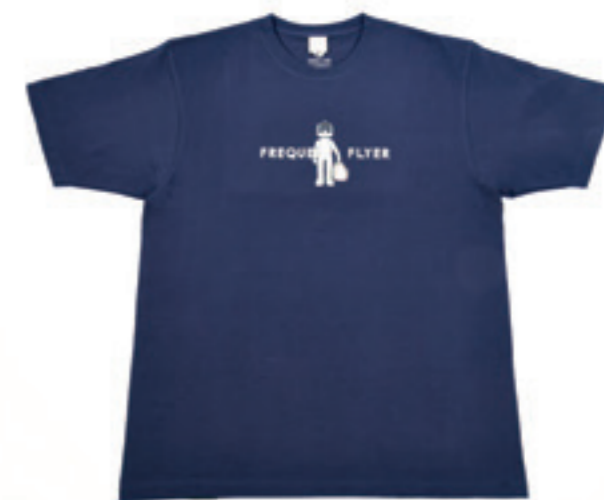
Product Name 產品名稱： Ellon Tee 伊隆 Tee