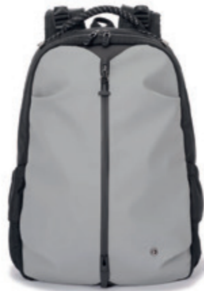
Product Name 產品名稱： Voler 飛行背包

Product Sizing(mm) 產品尺寸(毫米)： 380*80*270(mm) 8(L)