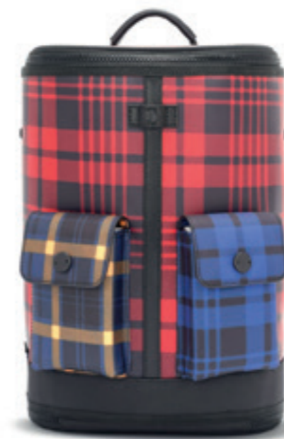
Product Name 產品名稱： Captain M 機長M