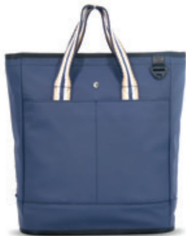
Product Name 產品名稱： Oxford-Stand up 牛津

Product Sizing(mm) 產品尺寸(毫米)： 290*150*415(mm) 16(L)