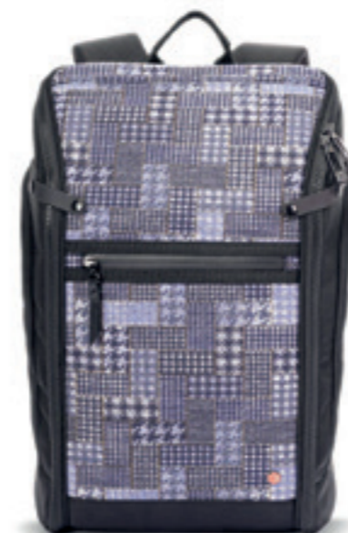
Product Name 產品名稱： Pilot M 飛行員