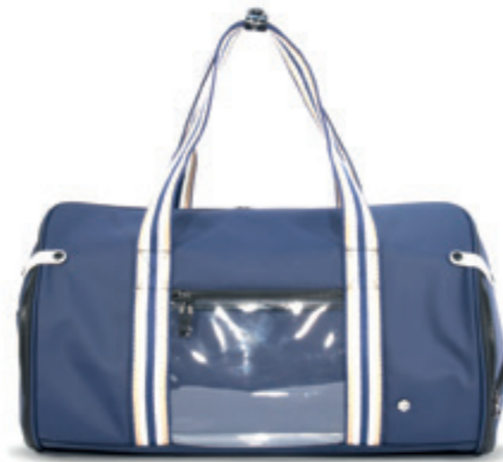
Product Name 產品名稱： James Duffel L 詹姆斯 L