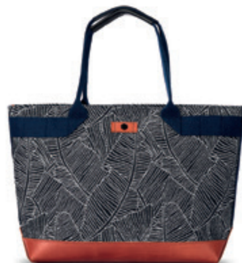
Product Name 產品名稱： Engine 突破號

Product Sizing(mm) 產品尺寸(毫米)： 200*140*75(mm) 1.5(L)