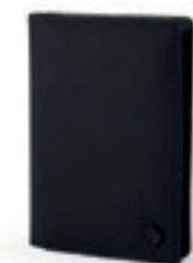
Product Name 產品名稱： Union 聯合護照夾

Collection Name 系列名稱： Dark knight 暗黑騎士系列