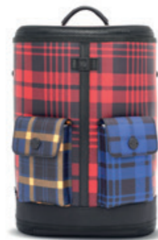
Product Name 產品名稱： Captain XS 機長XS

Product Sizing(mm) 產品尺寸(毫米)： 180*90*240(mm) 5(L)