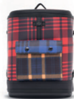
Product Name 產品名稱： Captain Mini 機長迷你

Product Sizing(mm) 產品尺寸(毫米)： 78*55*98(mm)