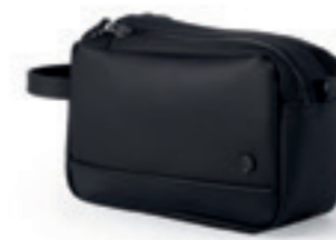
Product Name 產品名稱： Jungle 業林收納袋

Product Sizing(mm) 產品尺寸(毫米)： 280*170*410(mm) 16(L)