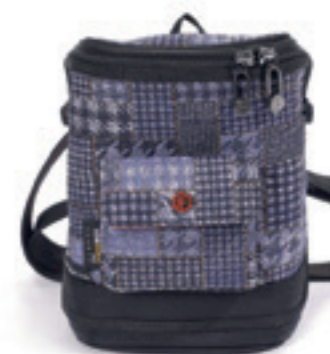
Product Name 產品名稱： Captain Ultra Mini 超微機長包

Product Sizing(mm) 產品尺寸(毫米)： 280*170*430(mm) 15(L)