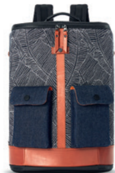
Product Name 產品名稱： Captain M 機長M

Product Sizing(mm) 產品尺寸(毫米)： 450*125*300(mm) 10(L)