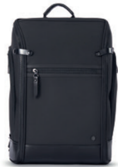
Product Name 產品名稱： Pilot M 猛禽M

Product Sizing(mm) 產品尺寸(毫米)： 490*260*330(mm) 38(L)