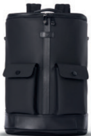
Product Name 產品名稱： Captain M 機長M

Product Sizing(mm) 產品尺寸(毫米)： 290*150*415(mm) 16(L)