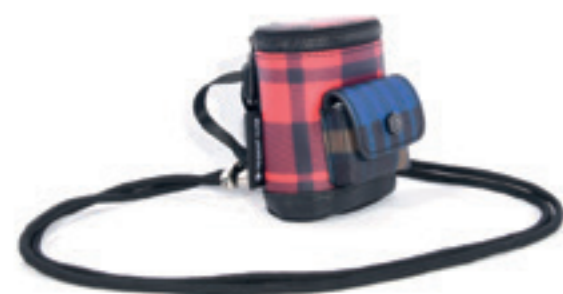
Product Name 產品名稱： Captain Nano 摩狐