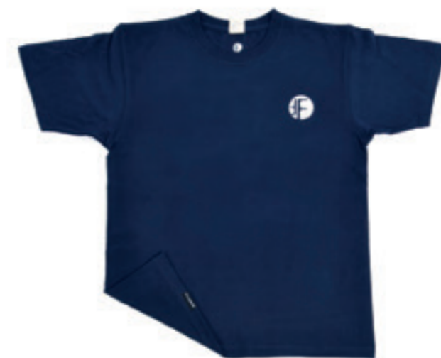
Product Name 產品名稱： Standard Tee FF Logo Women 女式 FF Logo標準T