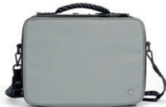
Product Name 產品名稱： Pinacle 13" 巔峰公事包 13"