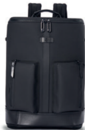
Product Name 產品名稱： Raptor 猛禽M

Product Sizing(mm) 產品尺寸(毫米)： 120*155*20(mm)