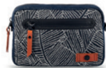
Product Name 產品名稱： MARK 20 馬克20

Collection Name 系列名稱： Folium Denim 樹葉牛仔系列