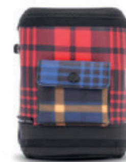
Product Name 產品名稱： Captain Ultra Mini 超微機長包

Product Sizing(mm) 產品尺寸(毫米)： 290*150*415mm 16(L)