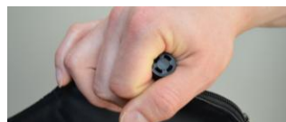
Tenir et soulever en gonflant